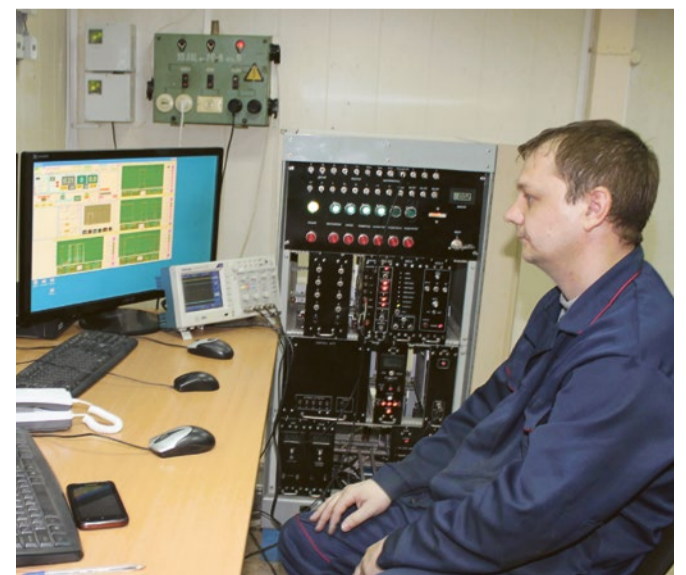
Пульт управления ИЛУ-10