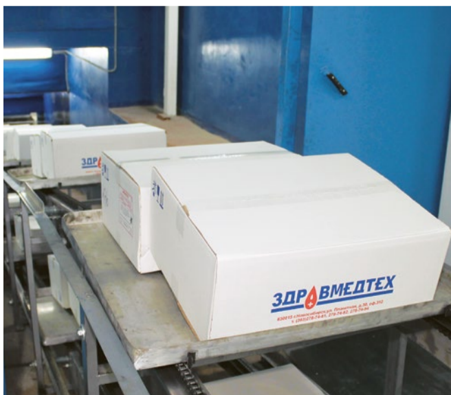
Медицинские изделия готовы к отправке