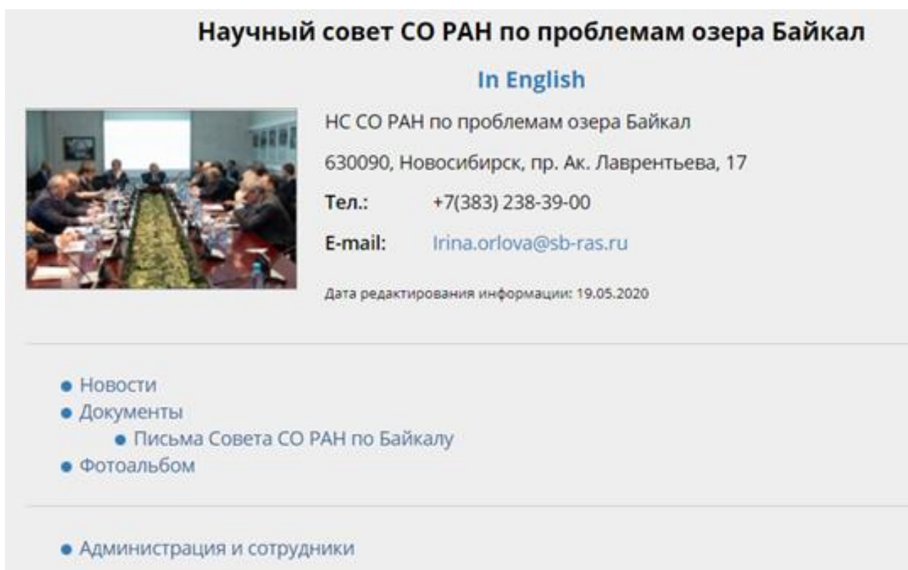
Рис. 1. Входная страница Научного совета СО РАН по проблемам озера Байкал

Раздел Совета по Байкалу (см. рис. 1) используется как рабочий инструмент, с момента образования 19.05.2020 размещено 65 документов с комментариями.