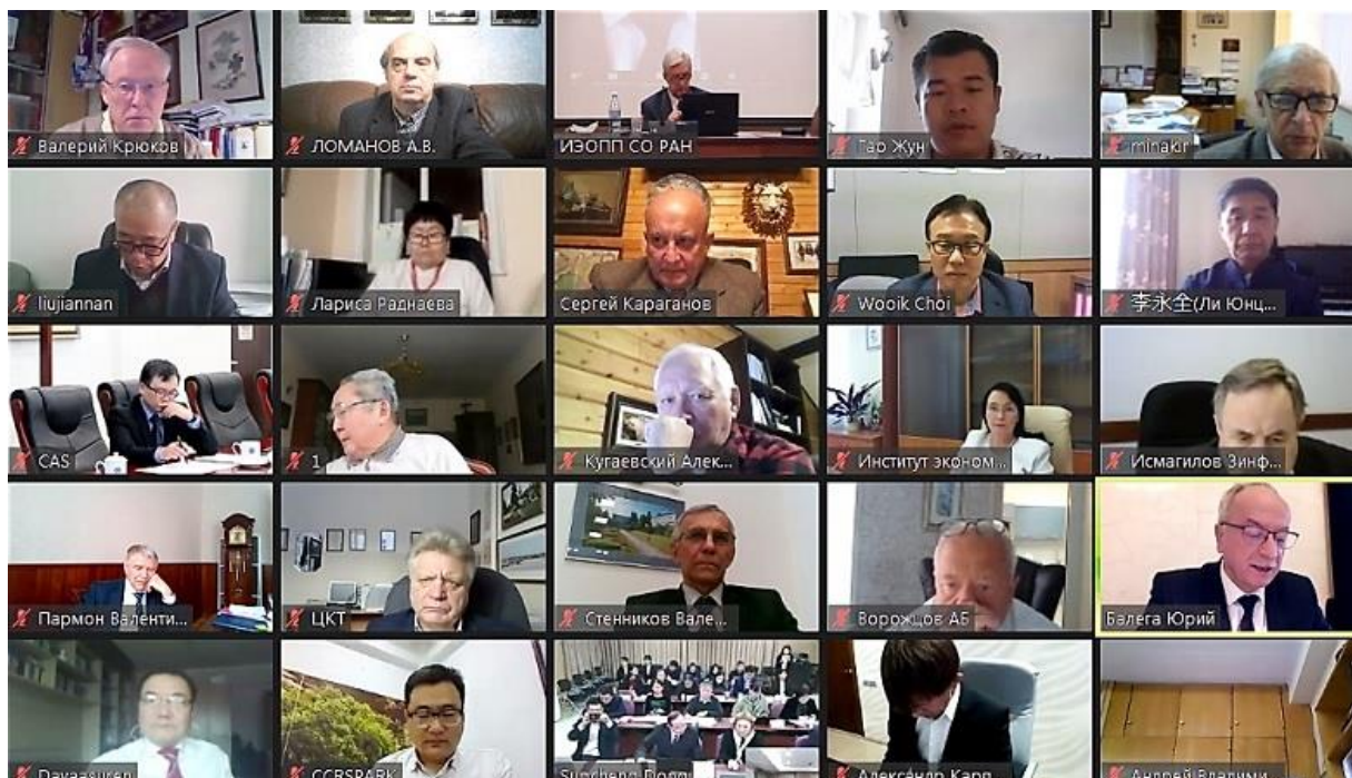
Рис. 3. Скан zoom-конференции МНЦТВ