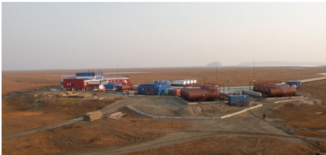
Научно-исследовательская станция ИНГГ СО РАН на острове Самойловский

– «Остров Самойловский» продолжает работу, хоть и в ограниченном режиме. В этом году мы провели на станции всего одну экспедицию, но надеемся, что в будущем году вернемся к привычной загрузке. Это будет связано, прежде всего, со снятием ограничительных мер в связи с пандемией.