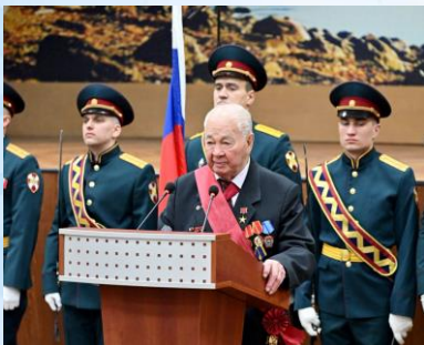
13 апреля 2026 г. АО «ФНПЦ «Алтай», г. Бийск