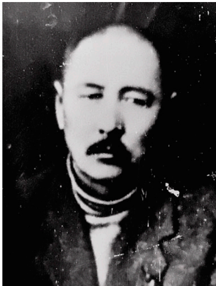
Барадин Б. Б. (1878—1937)