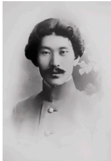
Ринчино Э.-Д. Р. (1888—1938)