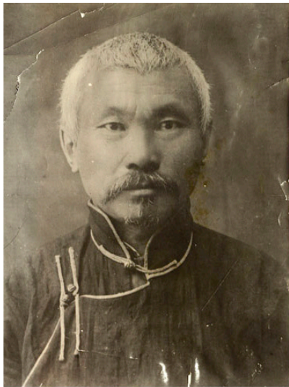
Жамцарано Ц. Ж. (1881—1942)