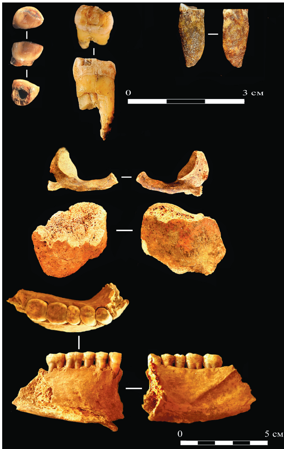
Антропологические остатки неандертальцев из Чагырской пещеры.