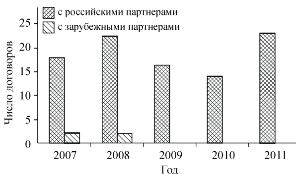
Рис. 3. Договоры о предоставлении прав на объекты интеллектуальной собственности институтов СО РАН (лицензии на использование изобретений, полезных моделей, программ для ЭВМ, баз данных, товарных знаков и ноу-хау, договоры об отчуждении исключительных прав)

В отчетном году продано 11 лицензий на использование изобретений, запатентованных в России (ИК — 4, ИХН — 2, ИМКЭС, ИХТТМ, ЛИН и НИОХ — по 1), с российскими организациями заключено четыре лицензионных соглашения на использование программы для ЭВМ (ИВТ), а также заключено два лицензионных договора на использование полезных моделей (ИАиЭ и ИК — по 1), три договора — на использование селекционных достижений (ИЦиГ), четыре договора — на использование ноу-хау (ИСЭ, ИФПМ, ИХН и ИЦиГ — по 1). Кроме того, с российскими организациями заключено 10 договоров о безвозмездном отчуждении исключительного права на изобретение (ИФПМ — 9, ИХТТМ — 1). Таким образом, было заключено 23 коммерческих договора о предоставлении прав на объ-