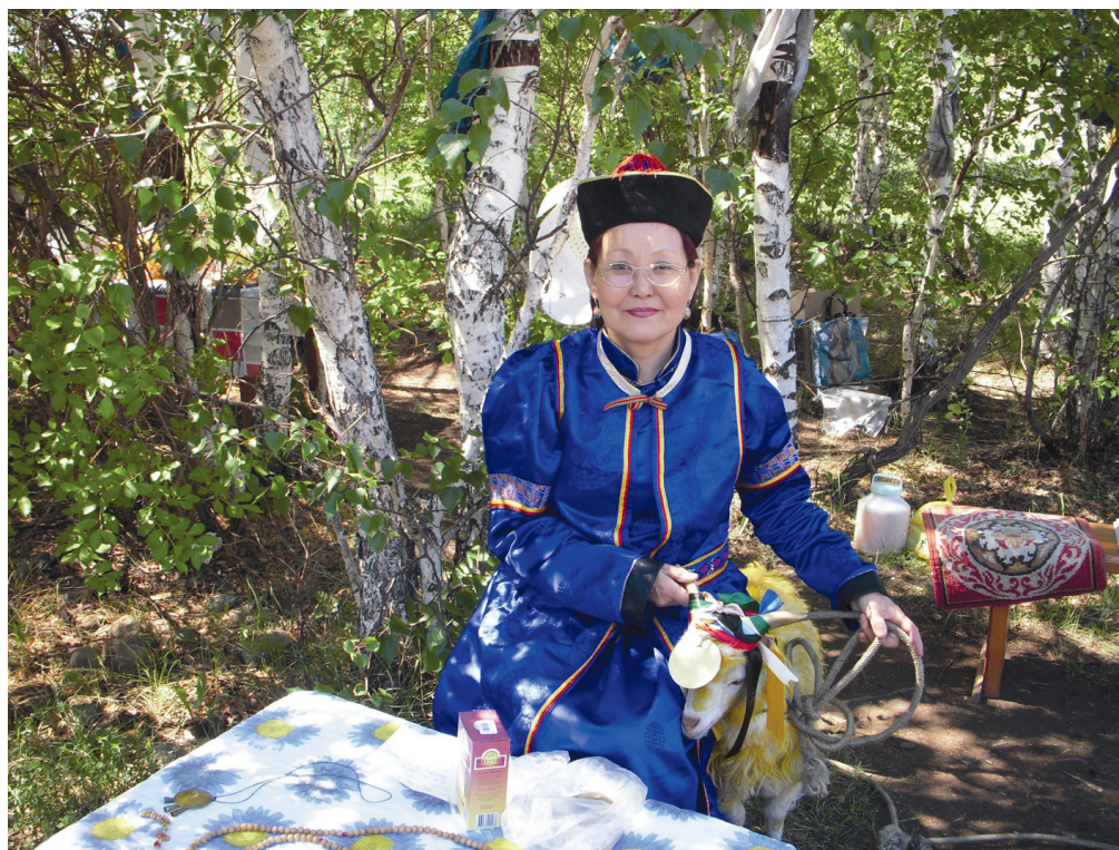
Рис. 13. Во время обряда посвящения в шаманы — посвящение божеству козла ( сэтэр ), полевые материалы 2009 г.

коннотативная семантика ритуального комплекса. Подразумеваемое постоянное присутствие «потусторонних» наблюдателей обуслов-