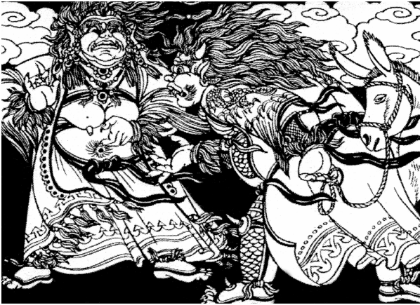
Рис. 13. Иллюстрация Ч. Б. Шонхорова к эпосу «Гэсэр». Мангадхайка Енхобой с братом Лойр Лоб-соголдой мангадхаем.