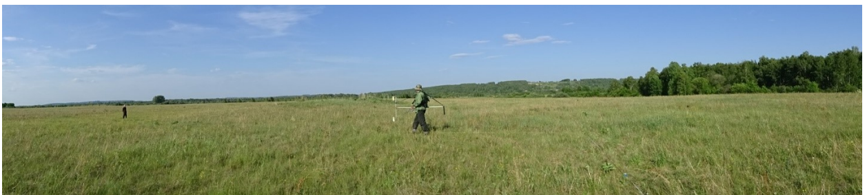
Курганный могильник Усть-Серта II (Мариинская лесостепь)

В дальнейшем в ИНГГ СО РАН планируют развивать методические подходы для повышения точности при определении параметров геомагнитного поля и выделении его аномалий.